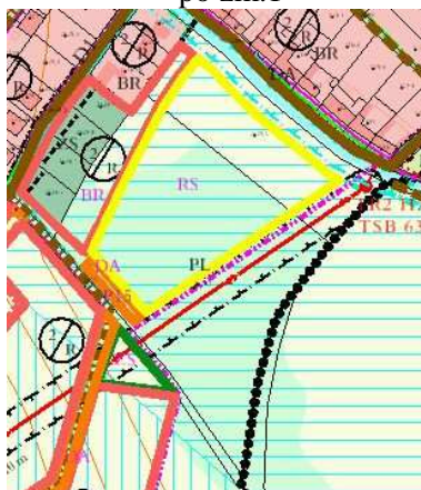
Platný ÚPO Horní Dunajovice po zm.1